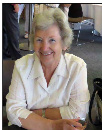
France Henry Aide pour les demandes de remboursement UNSMIS